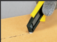
可以在纸箱上压折痕线